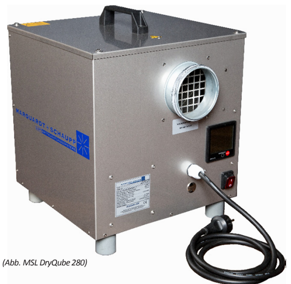
(Abb. MSL DryQube 280)